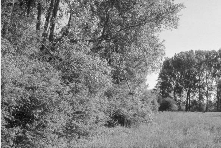
Abb. 1. Typisches trockenes Nachtigallenbiotop in der Petite Camargue Alsacienne. Das Nest befand sich in der Krautschicht am Waldrand. – Typical dry Nightingale habitat in the Petite Camargue Alsacienne. The nest was in the herbage at the edge of the wood.