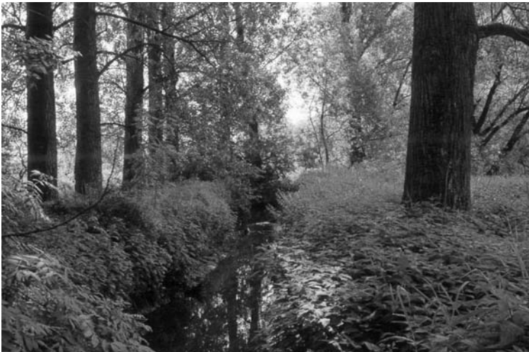
Abb. 3. Typisches feuchtes Nachtigallenbiotop. Das Nest befand sich in den Brennnesseln am rechten Bildrand. – Typical humid Nightingale habitat. The nest was in the nettles on the right.

♂ konkurrieren nicht nur direkt um ♀, sondern auch um Reviere, die für die längerfristige Bindung eines ♀ unerlässlich sind (Catchpole & Slater 1995). Die Anwesenheit vieler unver-